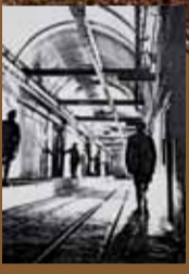
▲ Frontière française vue de la ligne Maginot la ligne présente de grave défauts : elle ne couvre qu'une partie de la frontière française ; elle manque de profondeur, son artillerie est faible et son champ de tir limité. ◀ Galerie de cellules à munitions.