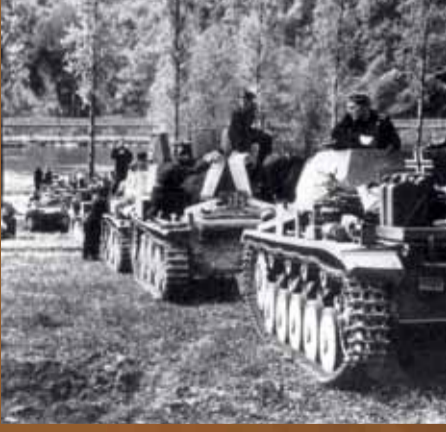
Colonne de chars de la 7 ème division blindée du général Rommel franchissant une rivière.