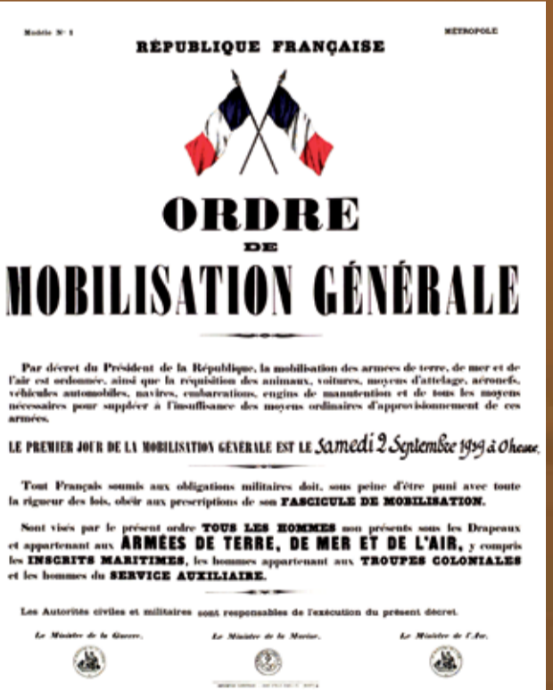
Affiche Ordre de mobilisation générale.