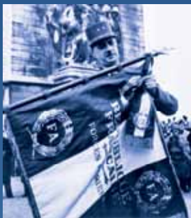
◀ A l'Arc de Triomphe, le Général de Gaulle épingle la croix de la libération sur le drapeau des parachutistes le 11 novembre 1944.