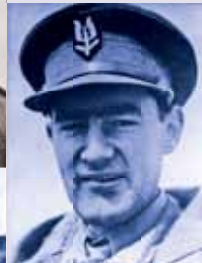
◀ Le Capitaine David Sterling, créateur du Special Air Service en 1941, est anobli par la reine après la guerre.