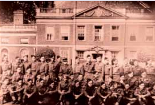
◀ La 1 ère Compagnie de parachutistes de la France libre.