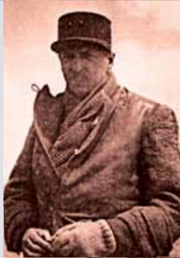
◀ Le général Pierre Kœnig.

Par sa résistance prolongée, du 26 mai au 11 juin 1942, la 1 ère brigade française libre permet à la VIII ème armée britannique de se dégager et d'éviter un désastre. Cette victoire a un retentissement considérable sur le territoire national et rend aux français, alors sous l'oppression allemande, la foi en leur destinée et l'espoir de la victoire.