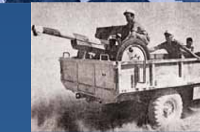
▲ Canon de 75, monté sur camion.