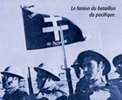
Le fanion du bataillon du pacifique.