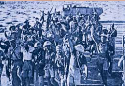
▶ A l'issue de la bataille de Bir Hakeim, la joie des rescapés de l'enfer.