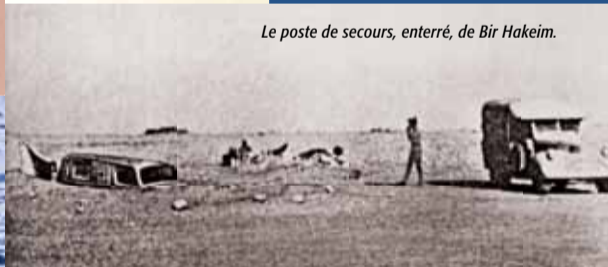
Le poste de secours, enterré, de Bir Hakeim.