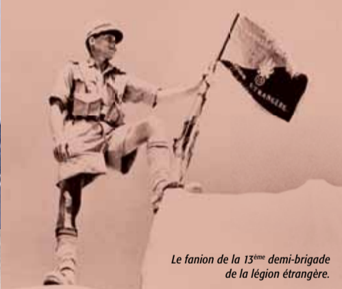
Le fanion de la 13 ème demi-brigade de la légion étrangère.