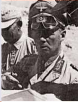
◀ Le général Rommel.

Télégramme du général de Gaulle au général Kœnig.