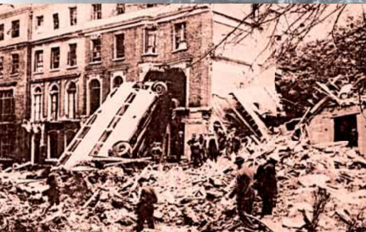
▲ Destrutions après le raid aérien du 7 septembre 1940.