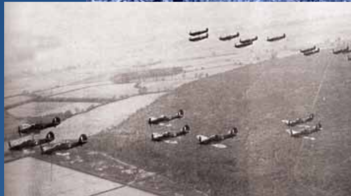
« Jamais dans toute l'histoire, le destin de tant de personnes n'avait résidé dans les mains de si peu d'hommes ».