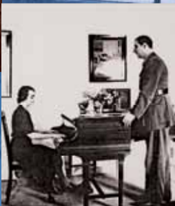
▶ Le Général de Gaulle et Madame de Gaulle dans leur maison de Hampstead à Londres.