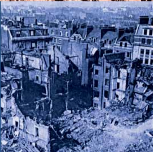
▶ L'immeuble de la B.B.C est bombardé mais les émissions continuent.