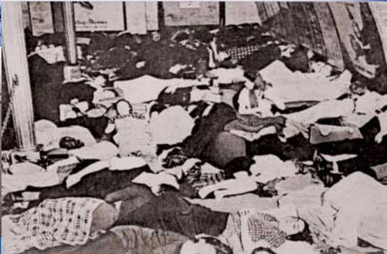
▲ Alerte aérienne, londoniens réfugiés dans le métro.