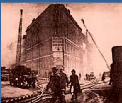
▶ La vie continue malgré les bombardements.