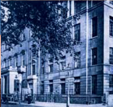
▶ Le n°4 Carlton Gardens, quartier général du Général de Gaulle à Londres.