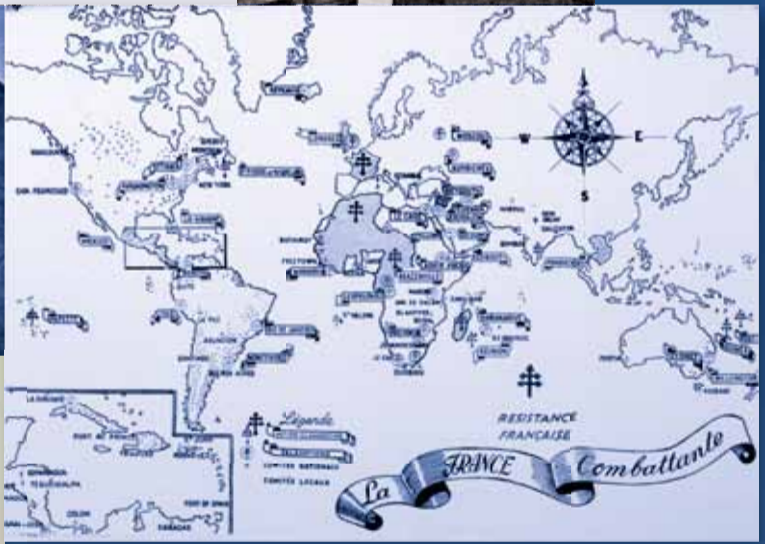
▲ Carte des comités français libres à l'étranger.