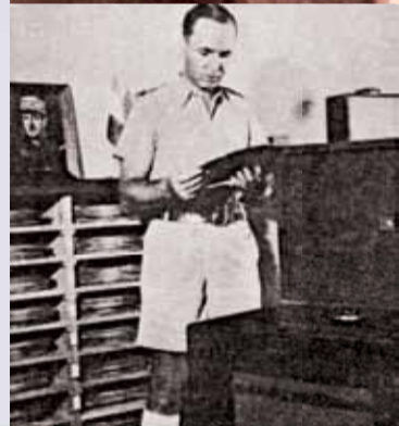
◀ Dans les locaux de radio-Brazzaville.