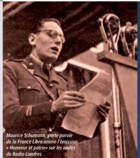
Maurice Schumann, porte parole de la France Libre anime l'émission « Honneur et patrie » sur les ondes de Radio-Londres.

Pour la fête nationale française, des meetings permettent à des milliers d'étrangers de manifester leur sympathie pour la France : tel ce meeting où le maire de New-York, Fiorello La Guardia, et le général Pershing affirment devant 30 000 personnes, leur foi dans la destinée de la France.