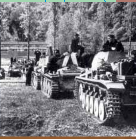
Colonne de chars de la 7 ème division blindée du général Rommel franchissant une rivière.