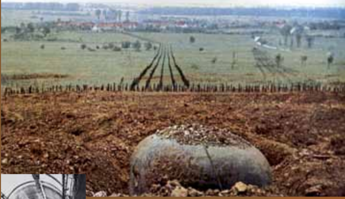
▲ Frontière française vue de la ligne Maginot la ligne présente de grave défauts : elle ne couvre qu'une partie de la frontière française ; elle manque de profondeur, son artillerie est faible et son champ de tir limité. ◀ Galerie de cellules à munitions.