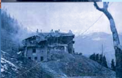
Le Berghof, le nid d'aigle ► d'Hitler en partie détruit.