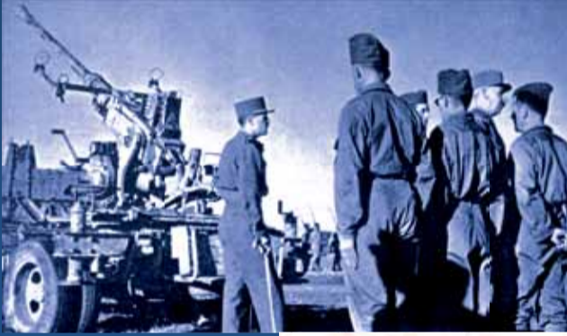
Leclerc et sa colonne arrivent au Maroc où sera formée la 2 ème DB.

Dissoute le 31 mars 1946, la 2 ème DB est reconstituée le 1 er juillet 1979.