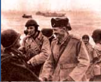
Le général Leclerc prend pied ► sur le sol de France.