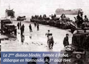
La 2 ème division blindée, formée à Rabat, ► débarque en Normandie, le 1 er août 1944.