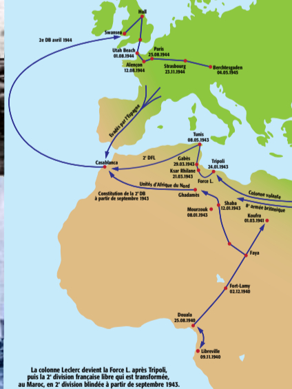
Itinéraire de la colonne ► Leclerc, devenue plus tard la 2 ème division blindée, de Douala à Berchtesgaden.