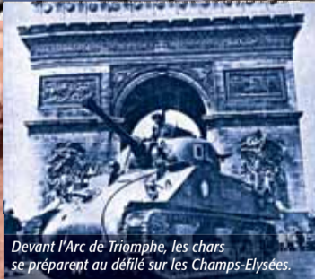
Devant l'Arc de Triomphe, les chars ► se préparent au défilé sur les Champs-Élysées.