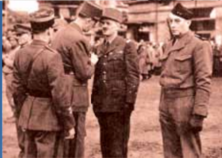
Colmar : le général de ► Gaulle, au cours d'une prise d'armes, remet au général Leclerc la plaque de grand officier de la légion d'honneur.