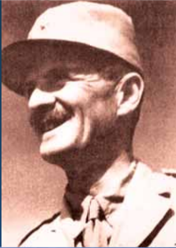
Le général, Maréchal de France, ► Philippe de Hautecloque dit Leclerc.

La 2 ème DB est créée au Maroc le 24 août 1943. Elle comprend environ 16 000 hommes au parcours très différent. Le noyau est constitué par les anciens de la colonne Leclerc, ralliés des premiers jours, qui ont participé à la campagne de Tunisie qui vient de se terminer par la défaite des forces de l'Axe commandées par Rommel. S'y ajoutent des unités de l'armée d'Afrique du Nord, des évadés de France par l'Espagne, des volontaires recrutés sur place. Seuls le charisme, la capacité de rassembler, du général Leclerc, permettra la fusion dans cette unité de combat exceptionnelle de composantes très diverses et parfois même opposées, à l'origine.