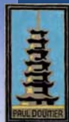
Le paquebot Président Doumer transportant des troupes dans l'océan indien, est coulé par un sous-marin allemand (U-Boot) le 30 octobre 1942.