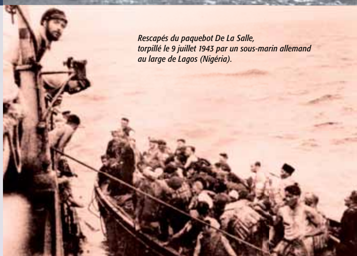
Rescapés du paquebot De La Salle, torpillé le 9 juillet 1943 par un sous-marin allemand au large de Lagos (Nigéria).

A l'armistice de juin 1940, un quart de la marine marchande française se soustrait au contrôle de Vichy pour se rallier à la France Libre. Les personnels de la marine marchande n'ont pas été convaincus par les exhortations de l'amiral Darlan, les engageant à respecter les conditions de l'armistice et à rester fidèles à Vichy. Ce sont plus d'un millier qui, pendant l'année 1940, fournissent l'essentiel du recrutement de la marine libre. Au début de 1943, la marine marchande française libre comprend 153 navires. Environ 100 000 tonnes de marchandises ou de matériel destinés aux alliés sont transportés, chaque mois, par des navires français à croix de Lorraine, ainsi que des centaines de milliers d'hommes de troupe. Mais 310 000 tonnes de bateaux marchands français libres sont coulés par l'ennemi entre 1940 et 1945. Au jour J, dans la troisième vague du débarquement de Normandie le 7 juin 1944, la marine marchande française libre transporte troupes et véhicules.