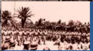
La 1 ère DFL et la colonne Leclerc au défilé de la victoire à Tunis, le 7 mai 1943.