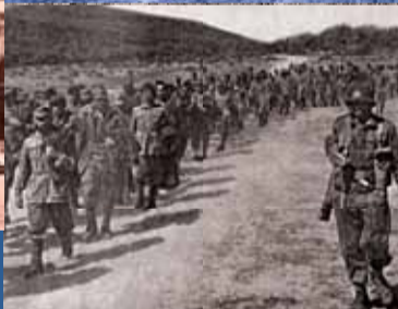
Une colonne de prisonniers allemands acheminée vers l'arrière du front tunisien.