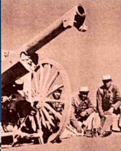
La légion étrangère à Tripoli.