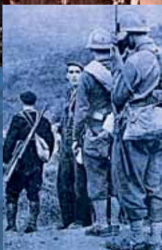
Partisans corses guidant les soldats français.