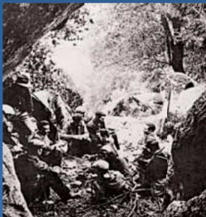
Groupe de partisans corses dans les montagnes.