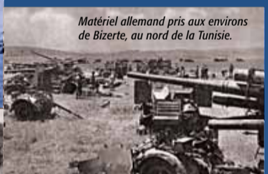
Matériel allemand pris aux environs de Bizerte, au nord de la Tunisie.