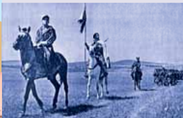
Défilé d'un Tabor à proximité du front tunisien.

Quatre mois après la libération de Tunis le 7 mai 1943 , au moment où les premières troupes alliées débarquent en Calabre, la résistance corse s'empare de la préfecture d'Ajaccio le 9 septembre 1943 . Pour contrer la tentative allemande de reprendre le contrôle de l'île, le général Giraud décide d'envoyer une compagnie du Bataillon de choc et un groupe de Tabors marocains. Le 17 septembre, le général Henri Martin débarque en Corse avec le 1 er corps d'armée, c'est l'opération Vésuve . En trois semaines, la Corse devient le premier département français libéré . Le 8 octobre, la population réserve à de Gaulle un accueil triomphal : « c'est d'Ajaccio, déclare-t-il, que nous affirmons la volonté de la France de déployer sa force renaissante, aux côtés des vaillantes forces de l'Angleterre et des Etats-Unis ».