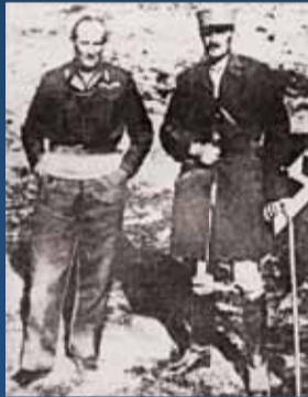
Rencontre des généraux Montgomery et Leclerc à Tripoli (Libye) le 26 janvier 1943.