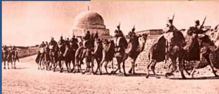
Méharistes dans le sud tunisien.

A u moment où les Anglo-saxons débarquent en Algérie et au Maroc le 8 novembre 1942, les Allemands prennent pied en Tunisie , sous administration vichyste, sans opposition des forces françaises commandées par le générale Barré, commandant supérieur des troupes françaises en Tunisie. Celui-ci rejoindra ultérieurement les alliés, où le commandement des troupes franco-anglo-américaines est confié au général Anderson, chef de la 1 ère armée britannique. Commandée par le général Juin , chef des forces terrestres françaises en Afrique du nord, sous les ordres du général Giraud, l'armée d'Afrique joue un rôle essentiel dans la campagne de Tunisie . Pour le général de Gaulle, il n'est pas question d'en tenir éloignées les Forces Françaises Libres : la colonne Leclerc du Tchad (rebaptisée « force L ») et le Bataillon d'infanterie de marine et du pacifique (BIMP) s'y illustrent aux côtés des troupes britanniques.