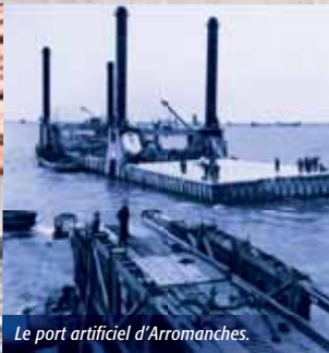
Le port artificiel d'Arromanches.