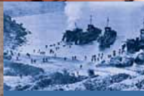
◀ Précédés par des parachutages massifs, les soldats de la 1 ère DFL débarquent en Provence le 15 août 1944.