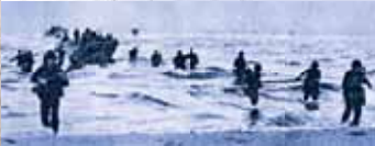
▲ Dans la nuit du 8 au 9 septembre 1943, Britanniques et Américains débarquent sur la plage de Paestum en Italie.