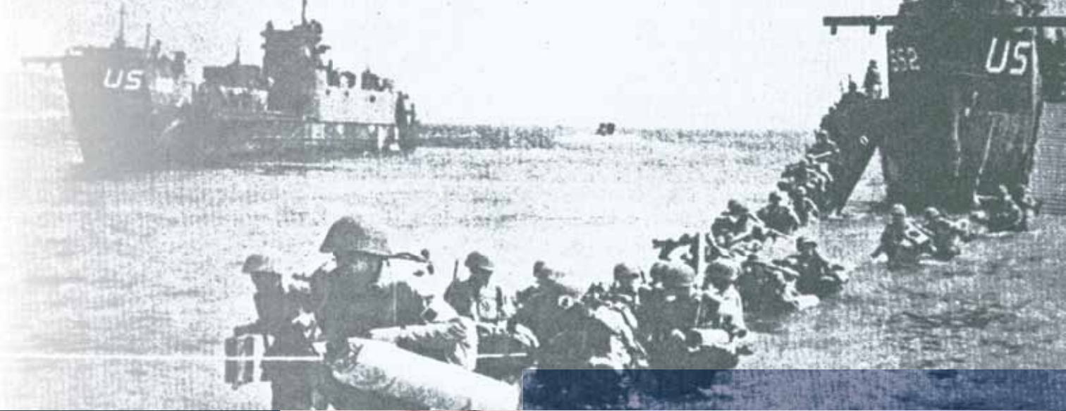
Le raid franco-britannique sur Dieppe ► ou « opération Jubilee » est repoussé par les Allemands le 19 août 1942.