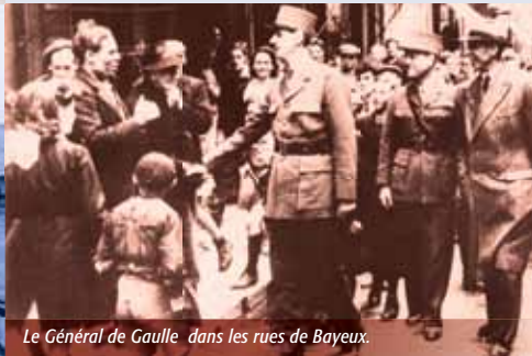
Le Général de Gaulle dans les rues de Bayeux.