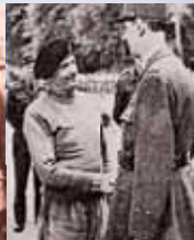
▲ Le Général de Gaulle rend visite au général Montgomery à son PC de Normandie.