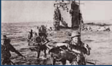
▲ Les britanniques débarquent en Sicile en juillet 1943.

Après le succès des débarquements en Afrique du nord et en Italie, l'état-major allié prépare en 1944 un nouveau débarquement massif sur les plages du Calvados et de la Manche. C'est l' opération Overlord . Elle doit permettre aux Alliés de prendre pied en Normandie avant de foncer vers l'est et le nord pour libérer l'Europe occidentale.