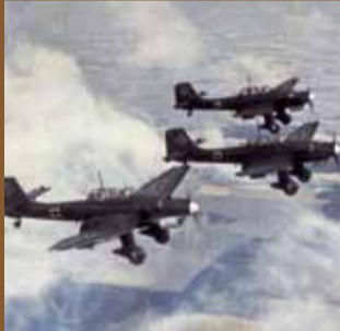
▲ Stukas dans le ciel belge.