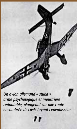
Un avion allemand « stuka », arme psychologique et meurtrière redoutable, plongeant sur une route encombrée de civils fuyant l'envahisseur.