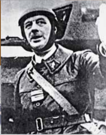
Le colonel de Gaulle, commandant la 4 ème division cuirassée, en tenue de tankiste.