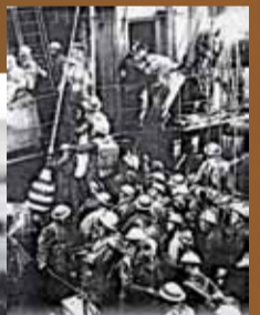
▲ L'embarquement des troupes britanniques à Dunkerque.