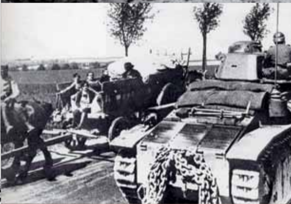
L'exode des populations belges puis des habitants des régions envahies fuyant les combats s'effectue dans le plus grand désordre. Cette panique trouble l'acheminement des renforts sur le front.