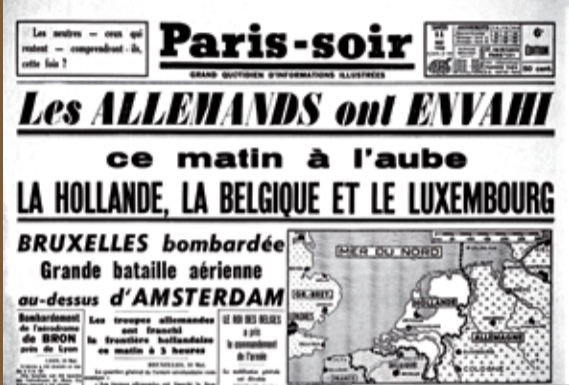
▲ Une du journal Paris-Soir du 11 mai 1940.