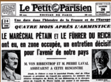
Une du Petit Parisien du 26 octobre 1940.