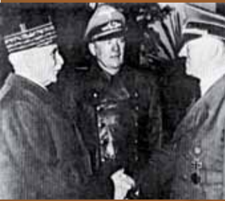
La poignée de main entre le Maréchal Pétain et le chancelier Adolf Hitler à Montoire, le 24 octobre 1940, inscrit le gouvernement de Vichy dans la voie de la collaboration.