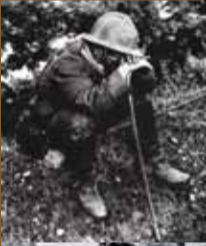
Sur le bord d'une route un artilleur français.