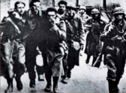
Juin 1940, des combattants français faits prisonniers.

Le 5 juin 1940, une nouvelle offensive de la Wehrmacht en direction du sud achève de bousculer les troupes françaises en déroute et entraîne un exode des populations civiles du nord de la France vers le Midi. Le 16 juin, jour où les Allemands passent la Loire à Orléans, le maréchal Pétain remplace Paul Reynaud à la tête du gouvernement réfugié à Bordeaux. Dès le lendemain, il demande à l'ennemi d'arrêter le combat. Hitler dicte ses conditions : l'armistice est signé à Rethondes , à l'endroit même où l'Allemagne avait signé l'armistice de 1918. Le territoire français, amputé des départements du Nord et du Pas-de-Calais et de l'Alsace-Lorraine, est divisé en une zone occupée et une zone dite libre , excluant toute ouverture sur la façade atlantique.