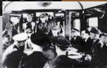
L'armistice est signé à Rethondes (Compiègne), dans le wagon historique où fut signé l'armistice de 1918. Pour Hitler, cet armistice doit effacer l'autre.