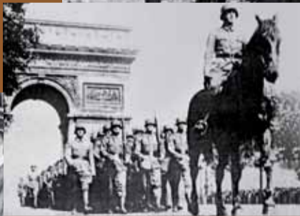
14 juin 1940 : les troupes allemandes défilent sur les Champs-Élysées à Paris, déclarée « ville ouverte ».