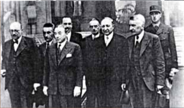
Le cabinet Paul Reynaud le 6 juin 1940 : au second rang, le général de Gaulle, secrétaire d'Etat à la défense nationale.