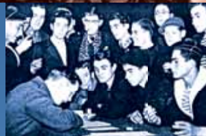
▲ Volontaires signant leur acte d'engagement à la France libre.