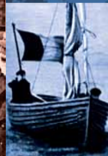
◀ Des volontaires isolés atteignent chaque jour l'Angleterre. Deux pêcheurs bretons signalent leur arrivée.