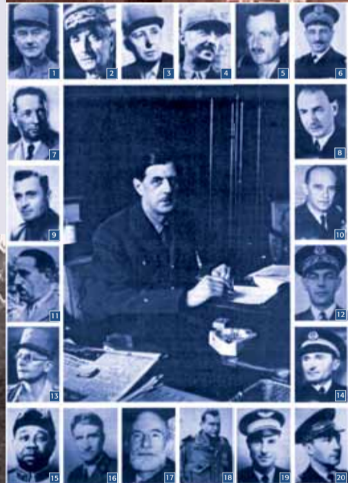
Des personnalités civiles et militaires de la France Libre.