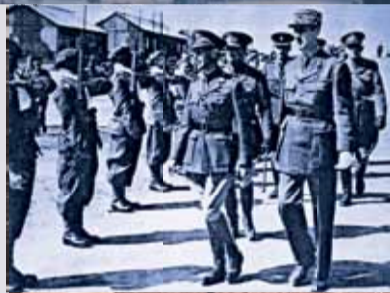
◀ Le roi Georges VI, accompagné du Général de Gaulle, inspecte les troupes françaises, Londres 1940.

Le 23 septembre 1941, il crée un comité national français , dont les membres se présentent comme des « gérants provisoires du patrimoine national ».