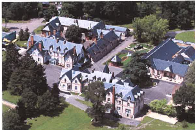
Vue partielle du site.

Face aux difficultés rencontrées pour trouver un site disponible sur Paris et en Ile de France nous avons réservé le site de la Fédération Nationale André Maginot dans le département du Cher, à NEUVY SUR BARANGEON :