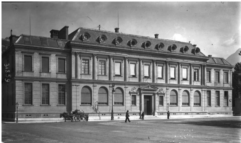
Faculté des Sciences de Grenoble