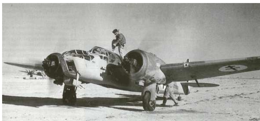
Bombardier Blenheim du Groupe Lorraine

Le 12/11/1941 pour se rapprocher de la ligne de front un premier détachement suivi de son échelon roulant part rejoindre à 250 km à l'ouest d'Alexandrie, le terrain LG103 aménagé en zone désertique à 10 km de la côte méditerranéenne à l'ouest du village de Fuka .