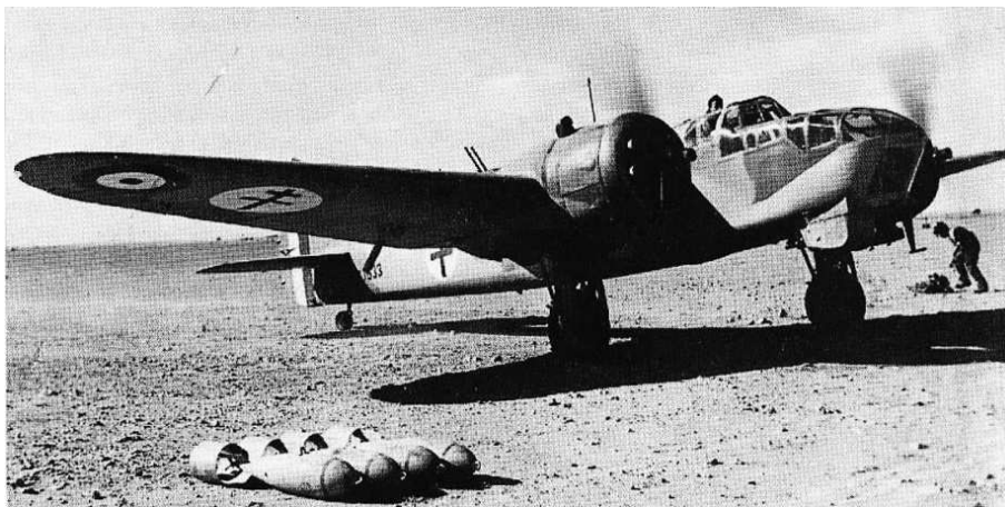
Blenheim du Groupe LORRAINE en Lybie