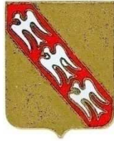
Insigne du Groupe de Bombardement LORRAINE

Le groupe est désormais équipé de 21 bombardiers Blenheim neufs envoyés d'Egypte composant deux escadrilles. Le personnel dénombre 36 officiers, 86 sous-officiers et 64 hommes du rang.