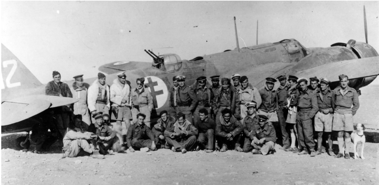
Camarades du Groupe LORRAINE devant le Blenheim n°12 sur le terrain LG75 à Fuka en Lybie