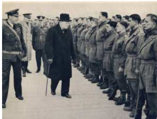
Winston CHURCHILL à Ringway

Le 25(26?)/04/1941 , le Premier Ministre Winston CHURCHILL vient à Ringway afin d'évaluer l'entraînement et la formation des unités parachutistes.