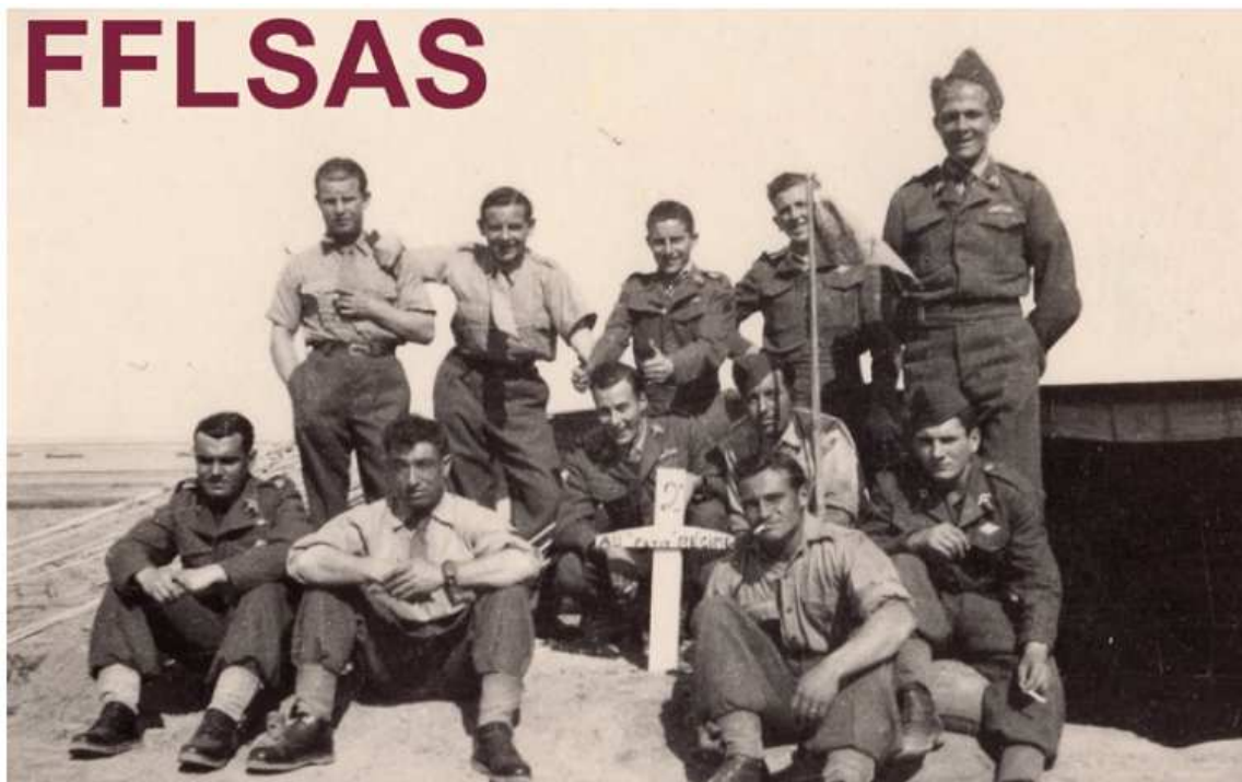
Ses camarades :

Le 25/09/1941 , par ordre du Général de LARMINAT, la « 1 ère C.P. » passe sous contrôle de l'Armée de Terre et devient le « Peloton Parachutiste du Levant ».