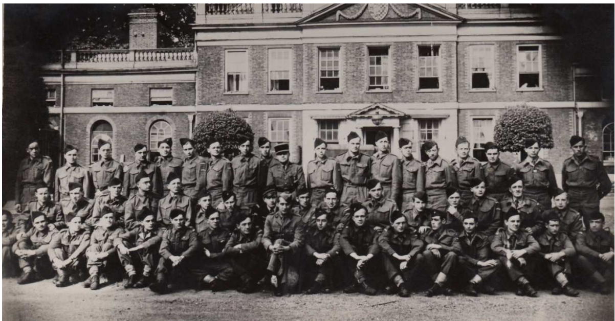
Juillet 1941 au camp de Barnes