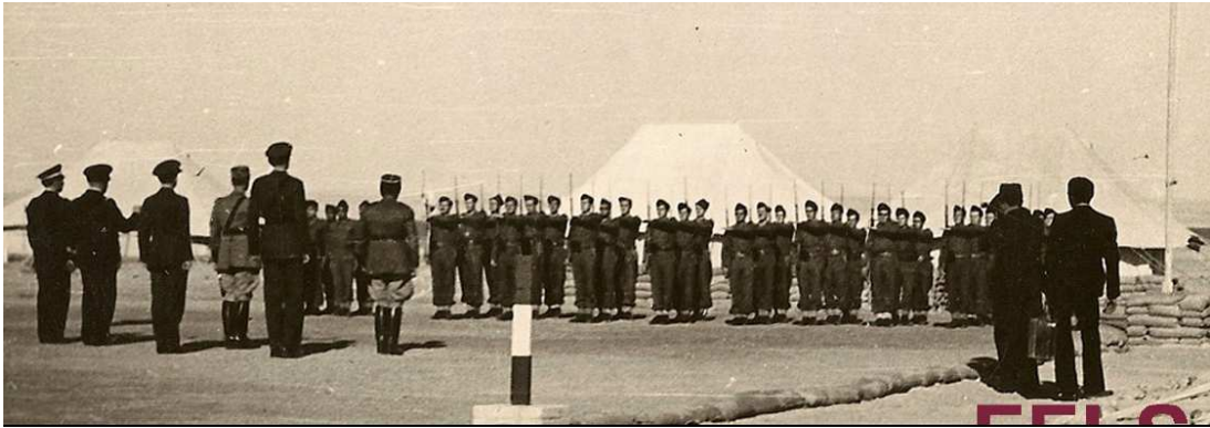
Le 1 er CCP présente les armes au Général CATROUX

Le 26/11/1941 , cérémonie devant le Général CATROUX qui passe en revue la 1 ère CCP.