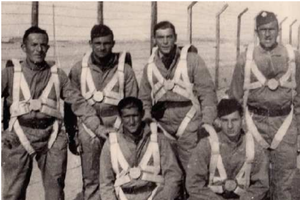
Prêts pour le saut