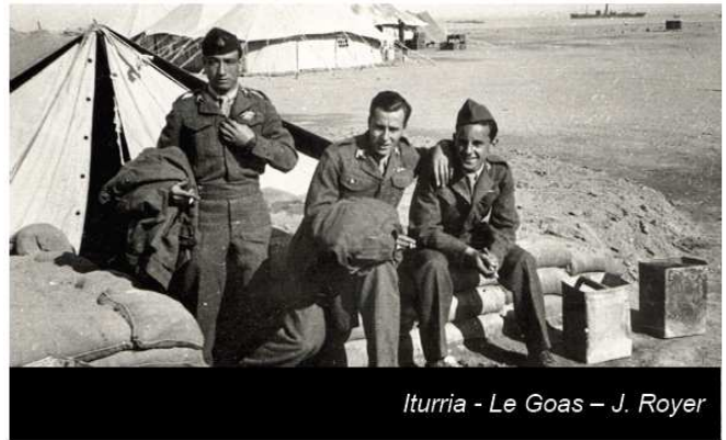
Iturria - Le Goas - J. Royer

Des camarades d'Henri (Coll. D. Portier)