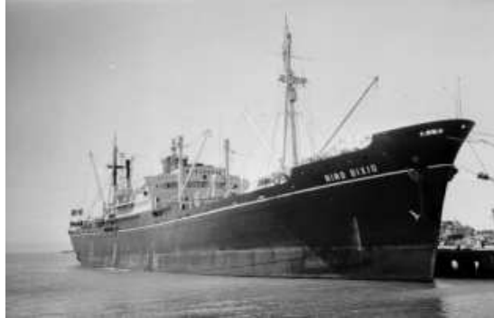
Cargo Nino-Bixio

LE NAUFRAGE - Le lundi 17 août 1942 , le cargo « Nino-Bixio » effectue la traversée de la Méditerranée. Il fait partie d'un convoi léger composé des deux cargos, accompagnés de deux destroyers et deux torpilleurs pour leurs protections.