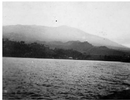
Baie de Freetown

Le 17/08/1941 , escale dans la baie de Freetown en Sierra-Leone pour ravitaillement.