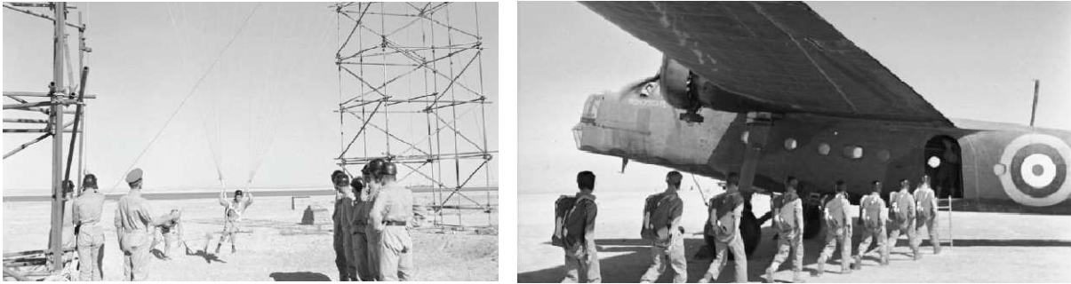
Entraînement au saut