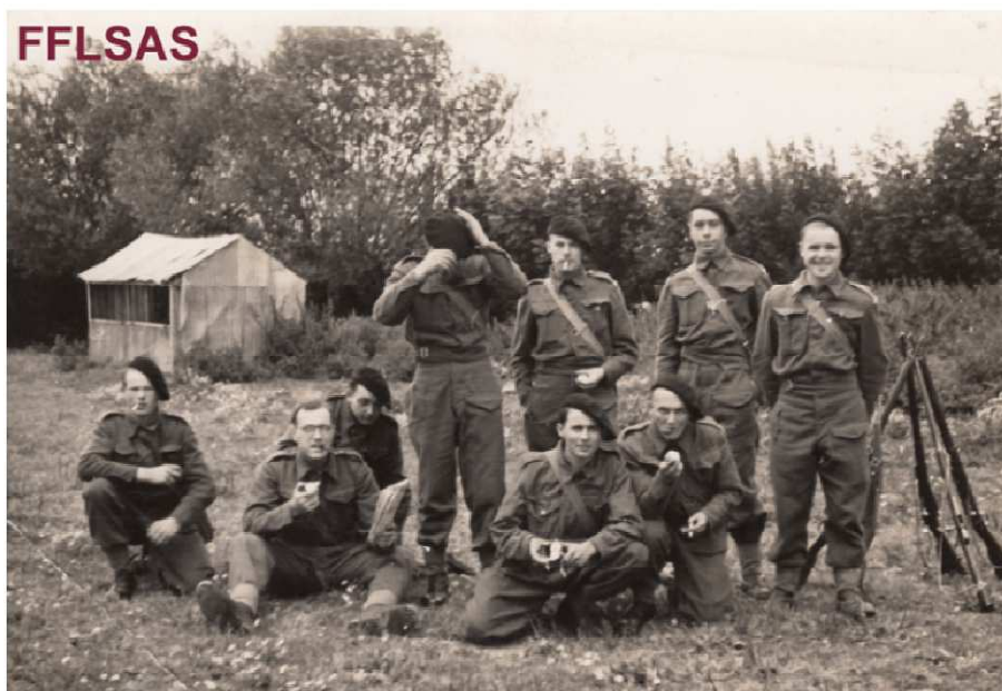
Ses camarades à Camberley

Le 24/12/1940 , le bataillon passe la veillée de Noël en compagnie du Général de GAULLE. Un grand spectacle est organisé avec les moyens du bord. Tous se retrouvent à la messe de minuit célébré par le Révérend Père TRENTESSAUX, aumônier du camp.