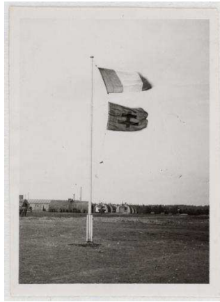
Centre d'Instruction de Camberley