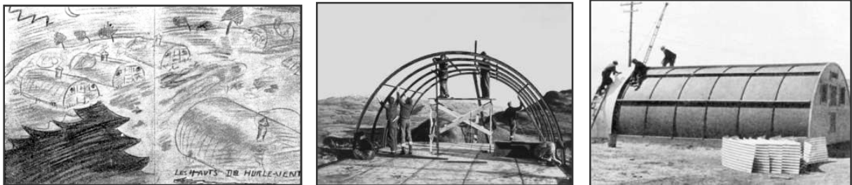
Construction des baraquements

Des baraquements mis en place, appelés « bidons » par les Français, sont des constructions préfabriquées sur un concept développé au cours de la première guerre mondiale par les britanniques. Dénommés « Nissen hut » ces bâtiments en forme de demi-tube possèdent une structure en bois et sont recouverts de tôles ondulées.