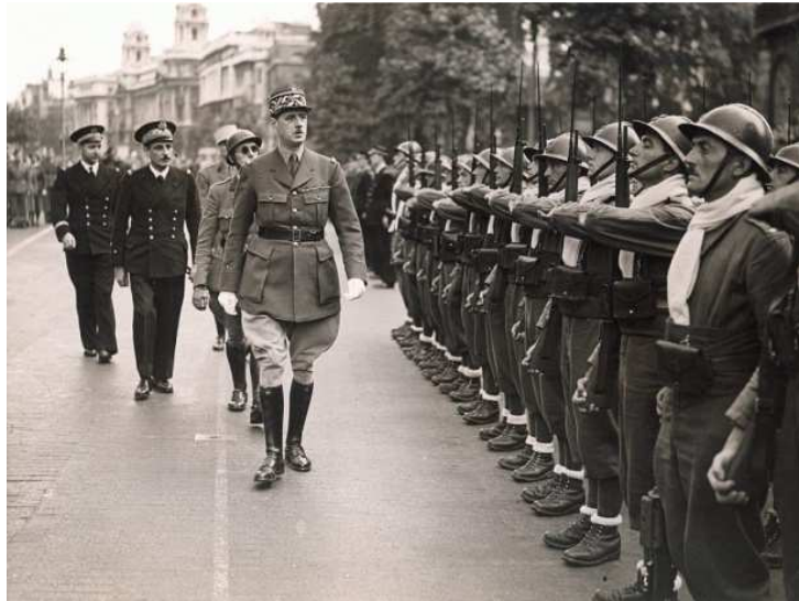
Défilé du 14 juillet 1940 à Londres Après avoir salué les aviateurs, le général de GAULLE passe en revue les chasseurs. Derrière lui à sa droite, l'Amiral MUSELIER commandant les FAFL et les FNFL.

Malgré le manque de matériel une période de formation à l'instruction militaire élémentaire va débiter sous les ordres du capitaine LALANDE et des lieutenants DUPONT et CHABERT.