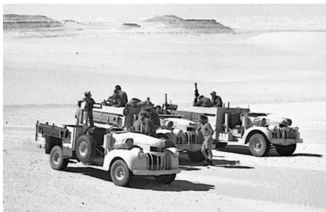
Véhicules du L.R.D.G