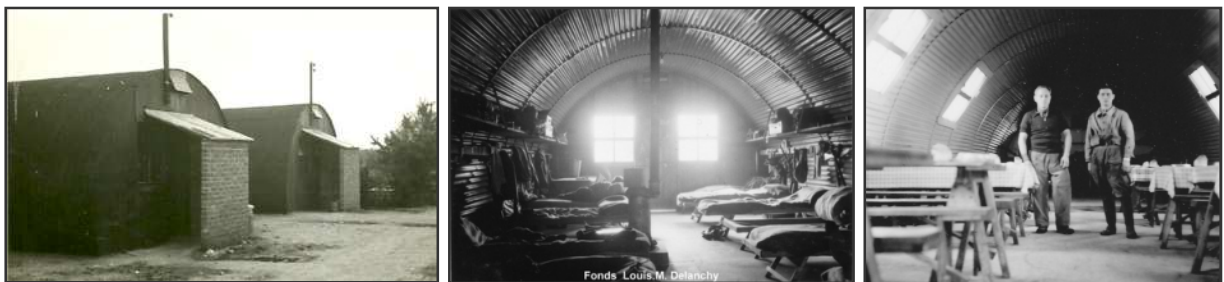
Camp de Camberley

Les « bidons » qui sont utilisés comme dortoirs accueillent environ une quinzaine d'hommes. Sur le chemin qui mène à la patte d'oie vont être élevés le carré des officiers et le parc à voitures, à l'extrémité opposée et près du raccourci qui mène à Camberley, le carré des sous-officiers ; dans une allée latérale, la chapelle, la salle des fêtes, l'infirmerie, le poste de police.