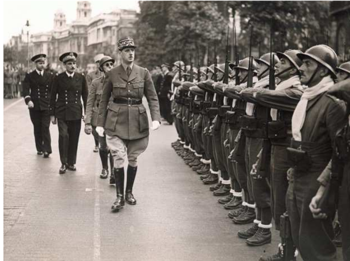
Défilé du 14 juillet 1940 à Londres Après avoir salué les aviateurs, le général de GAULLE passe en revue les chasseurs. Derrière lui à sa droite, l'Amiral MUSELIER commandant les FAFL et les FNFL.

Le 14/07/1940 , le bataillon défile à Londres devant le Général de GAULLE qui va le recevoir quelques jours plus tard au Delville Camp pour le passer en revue en compagnie du Roi George VI. La « Légion de GAULLE » est représentée par 40 légionnaires, 40 aviateurs, 40 chasseurs et 40 marins. Ce jour là, le gouvernement britannique a l'aimable courtoisie de faire hisser un immense drapeau tricolore sur l'une des tours du Palais de Westminster. Le défilé a lieu entre le Parlement de Westminster jusqu'à la statue du Maréchal FOCH, située à « Grosvenor Gardens », au pied de laquelle le Général de GAULLE dépose une couronne de fleurs.