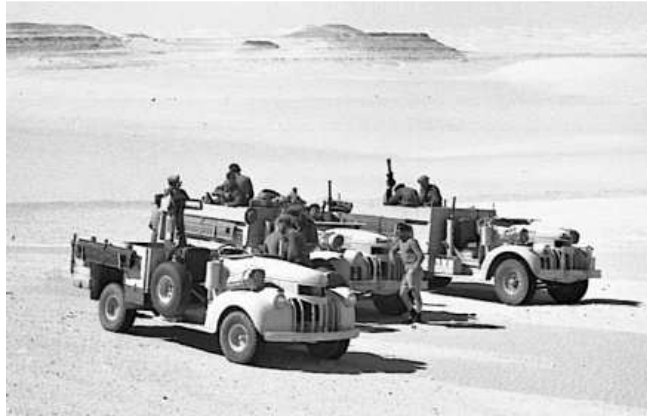
Véhicules du L.R.D.G (wardrawings.be)

C'est le capitaine néo-zélandais GUILD du L.R.D.G qui va accompagner les Groupes JORDAN, TURNERET et De BOURMONT. L'après-midi est occupée à préparer les véhicules. STIRLING distribue au chef de groupe les photos récentes des sites à atteindre. Le plan prévoit que les groupes seront transportés et déposés au plus près des aérodromes. Pour cela ils disposent chacun d'un camion bâché aux couleurs de l'Afrikakorps et d'hommes d'origine allemande, farouches opposants d'Hitler, qui serviront de chauffeur et accompagnateurs, les commandos français seront camouflés à l'arrière des camions.