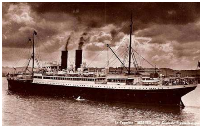
Paquebot Meknès