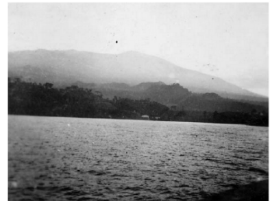
Baie de Freetown

Le 17/08/1941 , escale dans la baie de Freetown en Sierra-Léone pour ravitaillement.