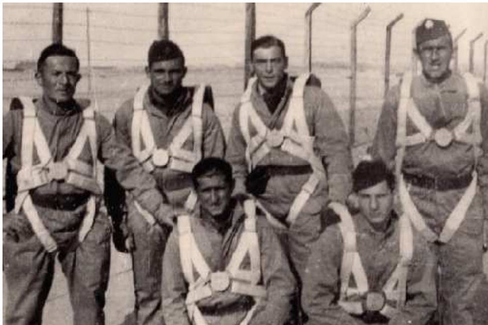
Ses camarades prêts pour le saut