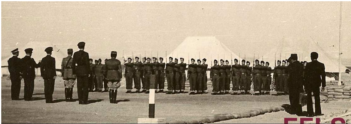
Le 1 er CCP présente les armes au Général CATROUX

Le 26/11/1941 , cérémonie devant le Général CATROUX qui passe en revue la 1 ère CCP.