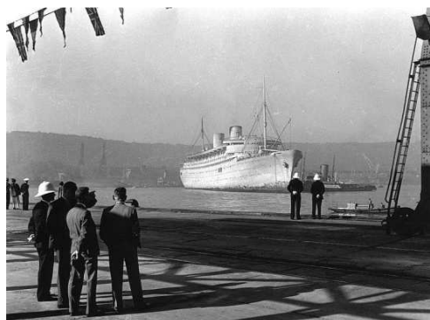
Le SS Nieuw-Amsterdam en escale au port de Durban

Le 05/09/1941 , escale au port de Durban en Afrique-du-Sud. La Compagnie de parachutistes débarque.