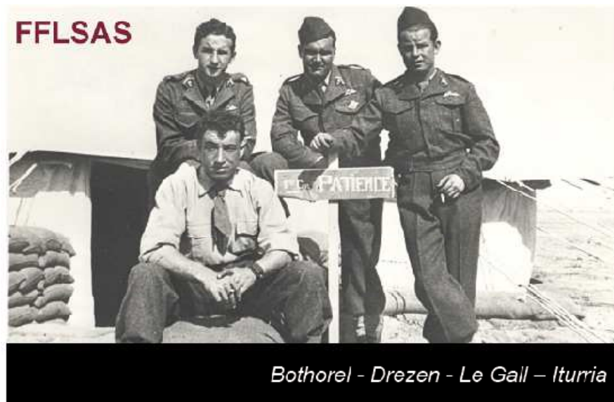
Ses camarades