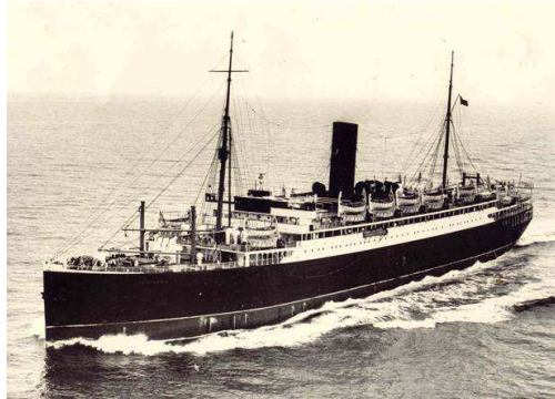
le « SS Cameronia »

Le 03/08/1941 , le navire prend la mer et intègre le convoi WS-10 en formation, comportant 16 navires de transport de troupes et 3 cargos de transport de matières explosives, le navire commandant étant le « SS Orcades ».