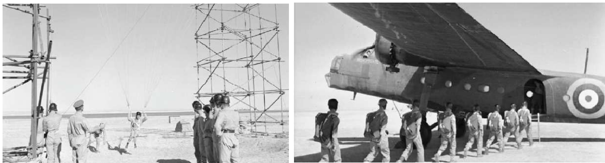
Entraînement au saut