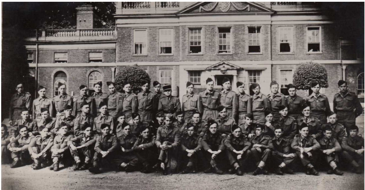
Juillet 1941 au camp de Barnes

Le 16/07/1941 , le reste de l'unité, soit une cinquantaine d'hommes, rejoint Londres et s'installe quelques jours au camp de transit de Barnes, Émile LOGEAIS en fait partie.