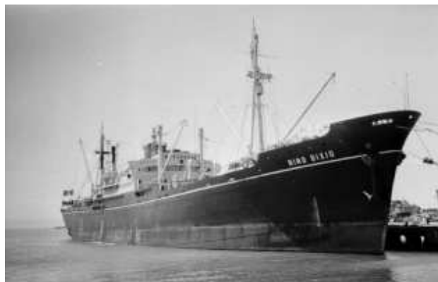
Cargo Nino-Bixio

LE NAUFRAGE - Le lundi 17 août 1942 , le cargo « Nino-Bixio » effectue la traversée de la Méditerranée. Il fait partie d'un convoi léger composé des deux cargos, accompagnés de deux destroyers et deux torpilleurs pour leurs protections.