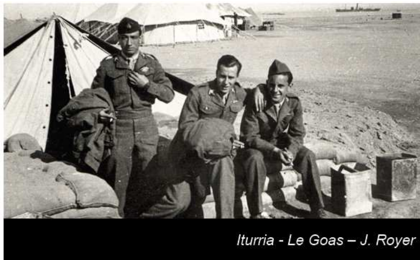
Ses camarades

Dans ce contexte, le Major David STIRLING propose à son Etat-Major d'intervenir avec ses hommes pour mener une opération commando en s'introduisant directement sur les aérodromes, où est installée l'aviation allemande, pour détruire un maximum de leurs avions. L'opération commando est accordée à STIRLING, elle concerne une série d'aérodromes libyens autour de Benghazi à plus de 150 km à l'arrière de la ligne de front, ainsi que l'aérodrome d'Héraklion situé sur l'île de Crète. Pour cela, ils vont obtenir le concours des membres du LRDG (Long Range Desert Group), que l'on surnomme « les rats du désert »..